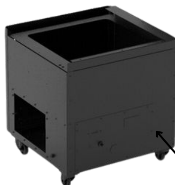
MODULE INFÉRIEUR BASE ATEX FILTRE PRINCIPAL BAS-V6-AS43