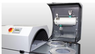
Le capot bascule pour accéder aux filtres et système de décolmatage pour une maintenance aisée