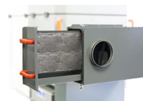
Trappe de maintenance latérale pour le nettoyage du préséparateur