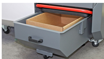
Tiroir de collecte de 90L avec carton à déchets